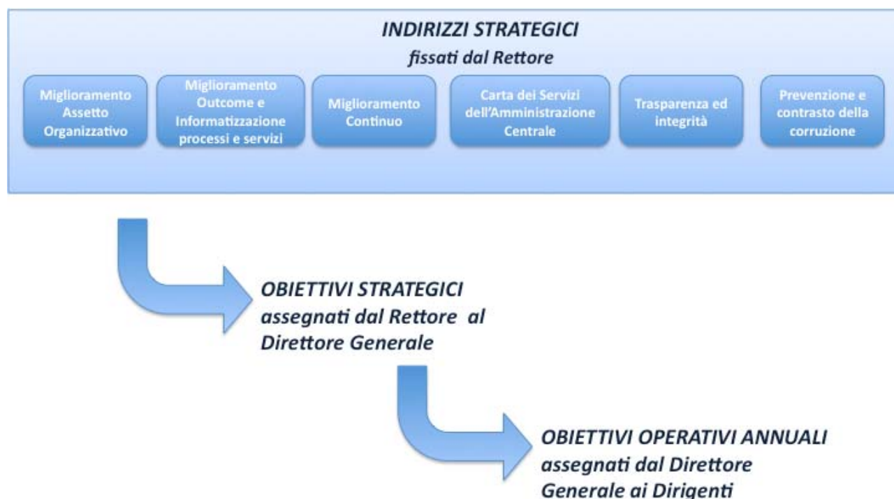
Figura 1: Cascading nella valutazione della Performance Organizzativa

Come evidenziato in figura 1, il Rettore, sulla base degli indirizzi strategici, definisce gli obiettivi strategici triennali, da assegnare al Direttore Generale con relativi target ed indicatori. Gli obiettivi strategici, riportati nel Piano, vengono declinati in obiettivi operativi annuali con relativi target ed indicatori, assegnati a cascata dal Direttore Generale ai Dirigenti.